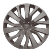
Ratkapna TONGARIRO 16"