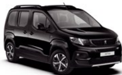
Crna Perla Nera