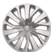
Ratkapna RAKIURA 16"