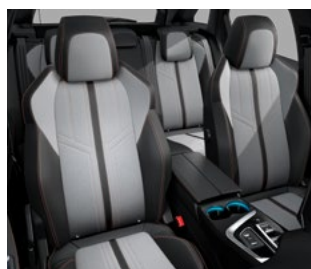
Leatherette & 'Colyn tkanina sa Mint šavom