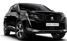
Crna Perla Nera