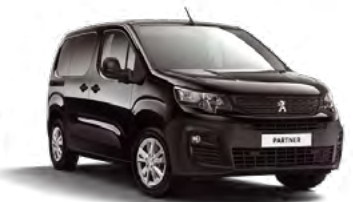
Crna Perla Nera