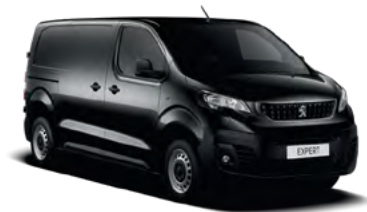
Crna Perla Nera