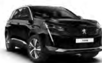
Crna Perla Nera